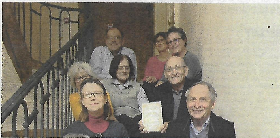
Les membres du bureau de la société savante.